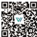
文康法律观察公众号