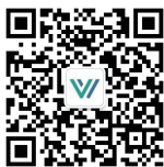
文康法律观察公众号